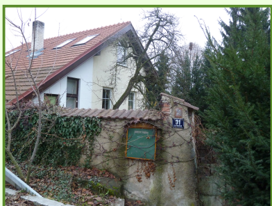
Nejstarší dům na Suchdole.

Suchdol byl založen Přemyslovci, v 10. století, na sklonku vlády knížete Boleslava I. (935-972). Na cestě z Levého Hradce na Pražský Hrad si v lesích na začátku rokle v Dolíkách zřídili nejprve loveckou chatrč, později byla přestavěna na myslivnu. Tento objekt je dodnes považován za první stavení v Suchdole. Přemyslovci začali, vzhledem k jeho poloze, v jeho blízkosti stavět další stavení, hradiště a dvorce, jak se dříve těmto obydlím říkalo.